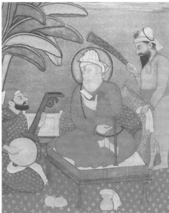
Гуру Нанак, основатель сикхской религии

Среди настоящих учителей есть различия по их способу достижения Истины и передачи её. Например, йоги гуру — это тот, кто овладел наукой йоги и усовершенствовался в ней через долгую и суровую садхану. Джняни {гьяни} гуру достигает истины посредством тонкого размышления над смыслом писаний и обобщения знаний. Постоянно пребывающий в Благе ( брахмаништха гуру ) — высшее духовно развитое существо. Это человек, свободный при жизни, не интересующийся телом ( видехамукта ) и связанными с ним заботами. Из недавно живших в этом мире Свами Сатьянанда считал таковым Рамана Махарши. Если ученик нуждается в учителе, то учитель нуждается в передаче знания (если он вообще в чём-то нуждается).