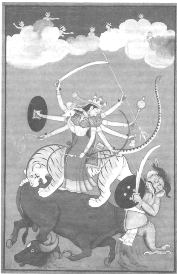
Победа богини Аурги над демоном Махисшей (Махишисасурамардини). XVIII век

Создания Всевышнего — и убийца, и жертва, и карающий убийцу палач. Раз убийца отнимает жизнь, пусть будет наказан. И пусть возмездие совершится как можно скорее, чтобы он быстрее понял, за что.