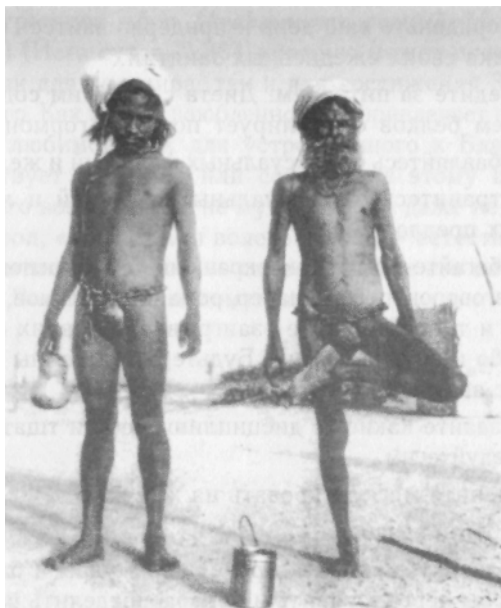
Подвижники, обуздывающие сексуальное влечение

Соблюдающий целомудрие для духовного познания должен воздерживаться также от самоэротизма и даже несознательных половых мечтаний. И тот, кто бегаёт похотливым взглядом и мыслью от одной женщины к другой, хоть и не касается их, позволяет себе матерщину, с увлечением читает или смотрит «порнуху», рассказывает скабрёзные анекдоты, — не воздержан. Не целомудрен и тот, кто по разным психологическим причинам (например, детство в неблагополучной семье, инфантилизм, психозы, половая слабость и т. п.) боится половых связей, хотя и хотел бы.