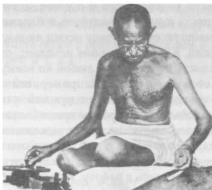
Ганди за ручной прялкой

Раз нельзя избежать работы, лучше постараться выполнить её лучше — не рабски, а творчески, не просто трудясь, а трудясь осмысленно, сознательно. Бхагавадгита определяет карма йогу как «в делах уменье (искусность, букв, «ухватка»)» (2.50).