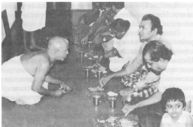
Угощение освящённой пищей в ашраме

Помогайте людям, но имейте в виду не пьянчужку какого-нибудь, а лучших. Не столько старушку, сколько молодёжь. Не столько прошлое, сколько будущее. Лучше дать не испитому калеке, а тому, кто играет на гармошке старинные напевы. Накормить одного мудрого лучше, чем раздать милостыню тысяче нищих. То, что вы даёте мудрому, — не ваша милостыня, а его милость вам.