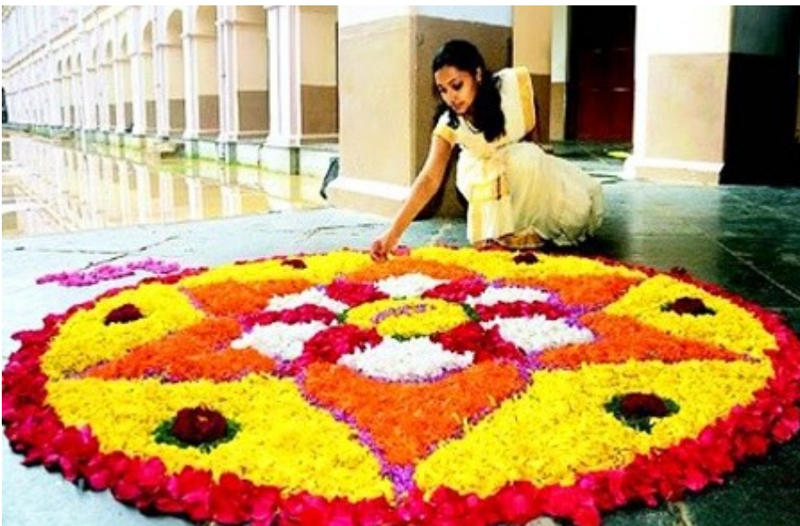
Девушка поправляет цветочный ковер

В первый день фестиваля индийцы зажигают факелы, ставят красочные флаги, чтобы вечером слоны и люди прошли веселым шествием вдоль яркой, освещенной аллеи. Затем наступает время обеда, где принято вкушать онам садья: священный обед из 13 блюд . Здесь подают рис, выращенный с новым урожаем, сладкие молочные десерты. Едят онам садья руками с банановых листьев.